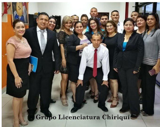
Grupo Licenciatura Chiriquí

Los participantes en este proyecto, son dirigentes sindicales que representan a las diversas centrales de trabajadores del país, a saber: