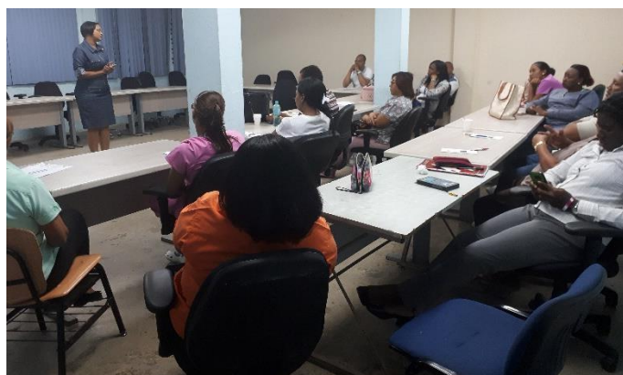
Ilustración 10. Reunión con graduados de UDELAS en la Escuela Vocacional Especial – EVE

El 28 de febrero se celebró reunión con los graduados de UDELAS en la sede de la Extensión Universitaria en Colón. Participaron 15 egresados titulados, dos de ellos eran varones. El objetivo de la reunión fue reiterarles la importancia de la Unidad de Relación con los Graduados y mantener la vinculación con la población de graduados.