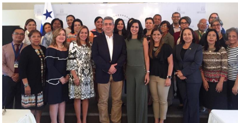
Ilustración 4. Participantes de la reunión

El Decanato de Extensión, en representación de UDELAS, participa de la primera reunión del Consejo Nacional de Atención Integral a la Primera Infancia, que fue presidida por la Ministra de Desarrollo Social, Michelle Muschett y el Ministro de Salud, Dr. Miguel Mayo. Esta reunión se celebró el 31 de enero en la Presidencia de la República y sirvió de marco para conocer los avances en materia de atención a la primera infancia, en temas sobre derecho a la identidad, educación y salud.