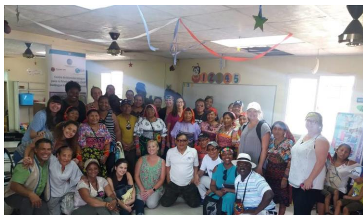
Ilustración 8. Intercambio en la Comunidad de Dagar Guna Yala, Vacamonte