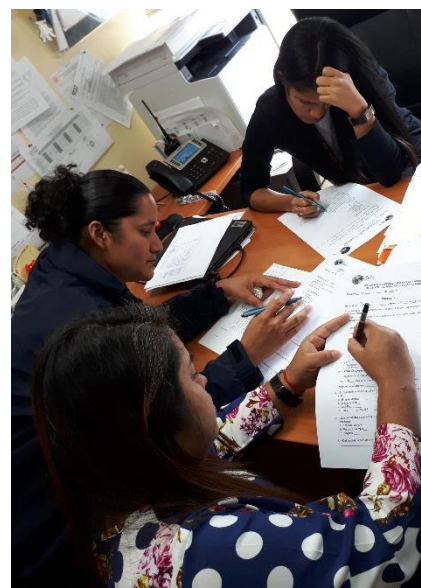
Ilustración 9. Visita al SUME 911